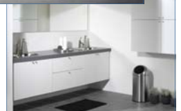
HTH køkken & bad