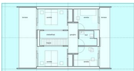
Grundplan for øverste dæk, med 2 forskellige indretningsmuligheder.

Telefon: +298 31 77 88 Telefax: +298 31 71 46 E-mail: shipsale@maretec.fo Internet: www.maretec.fo